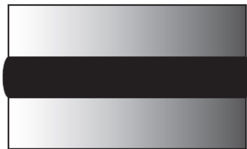
Рисунок 2 - Пример выпуклости надлежащей формы

Необходимо визуально убедиться, что на обрезанной поверхности образца образовалась небольшая выпуклость, радиусом 25% величины испытательного зазора между плитами. Пример выпуклости надлежащей формы представлен на рисунках 2 и 3.